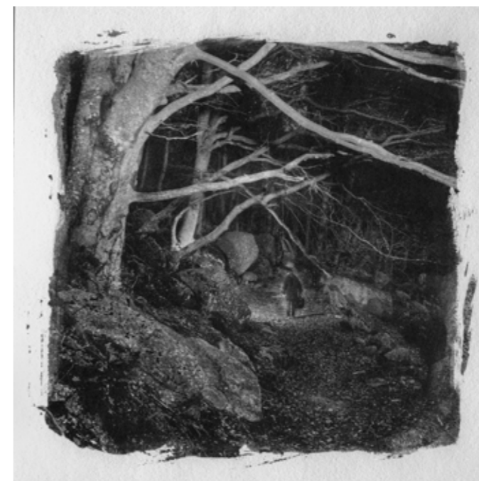
Érik Vacquier, L'homme blessé (SD)