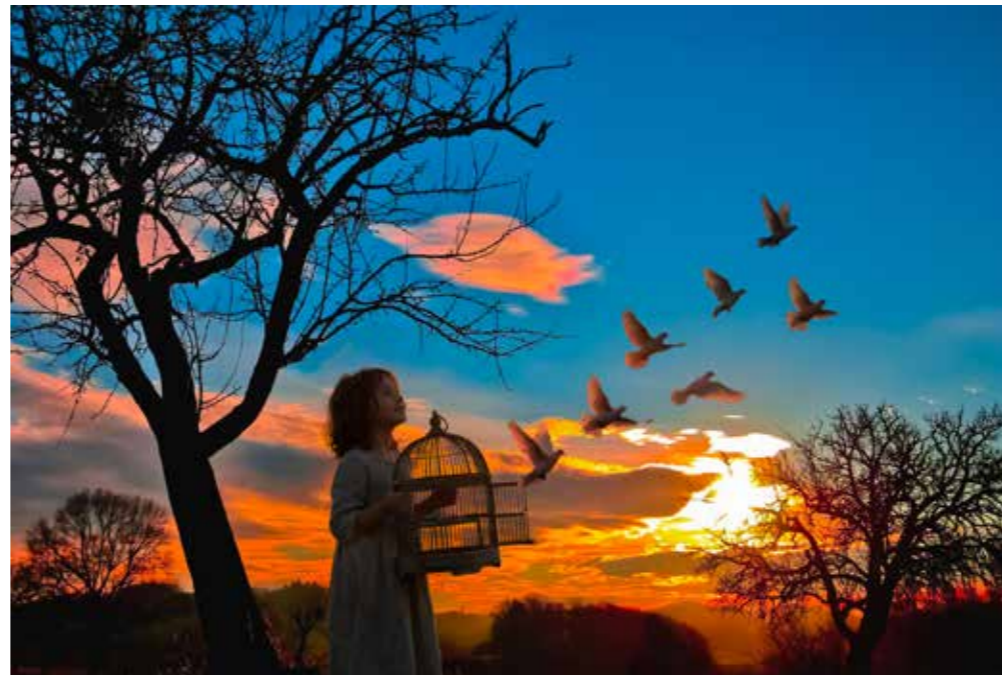
Jean-Claude Salhen, Envol vers la liberté, SD