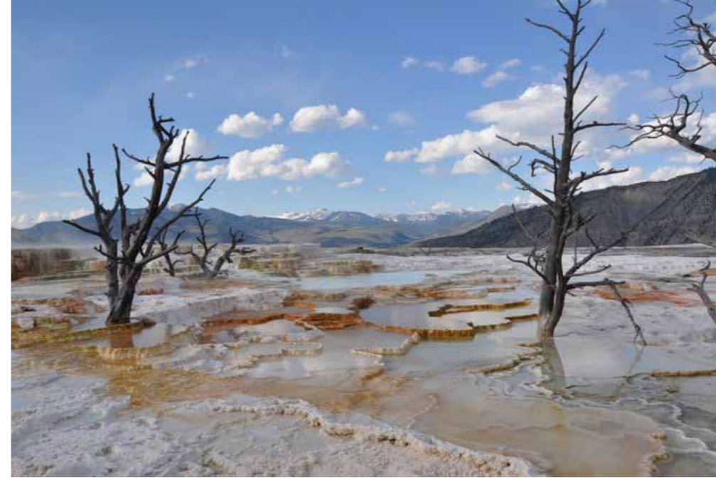
Parc de Yellowstone, Lucien Yvanoff, 2009