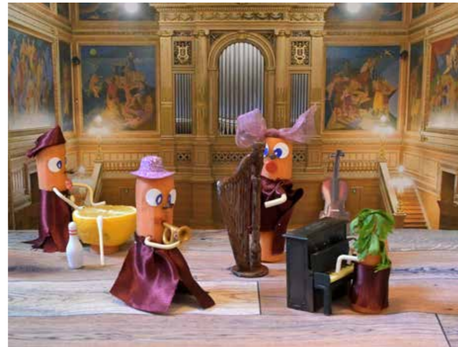
Laurence Charrié, Quatuor en répétition, SD