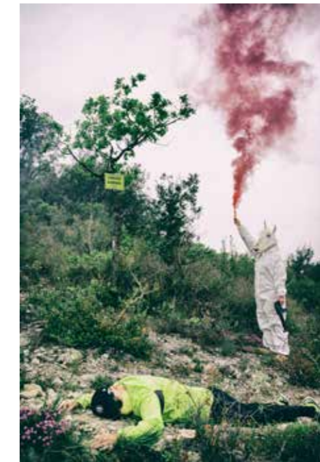
Yann Riché, Chasse gardée, 2020