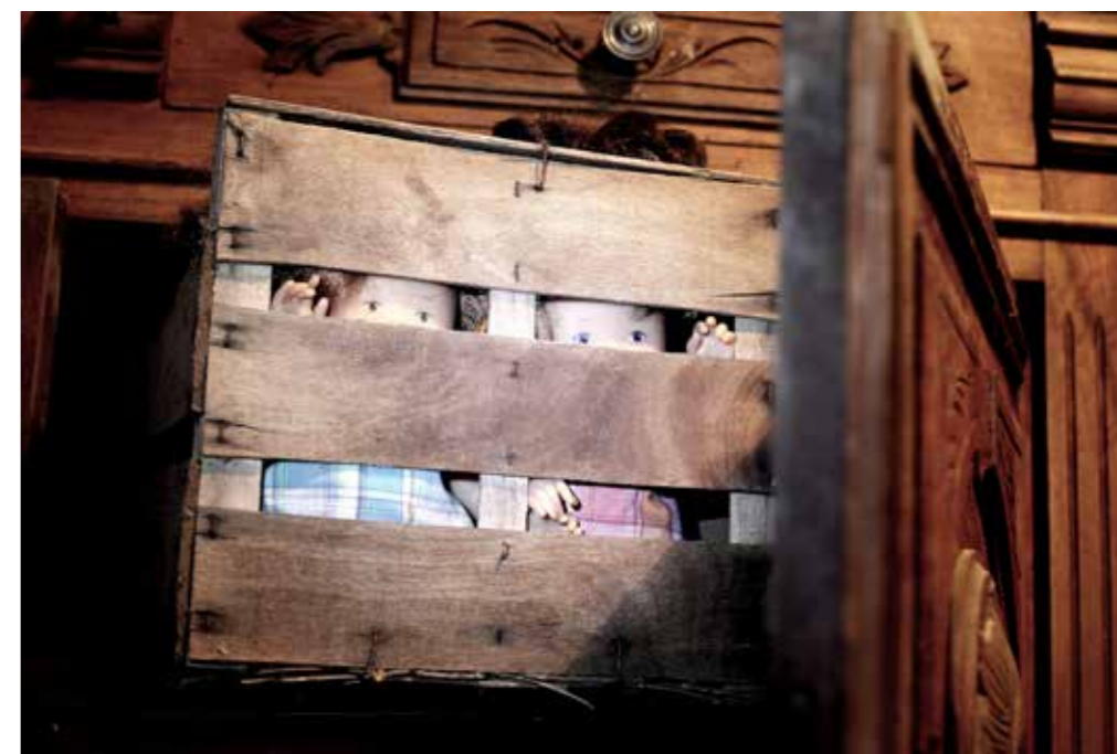
Gérard Jeanjean, Enfants (2015)