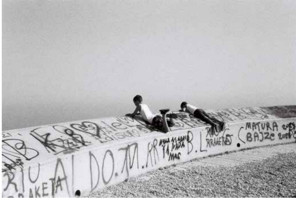
Ethel Grévoul, Demain, 2024