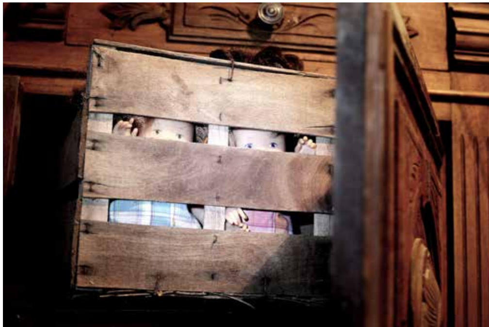
Gérard Jeanjean, Enfants, 2015