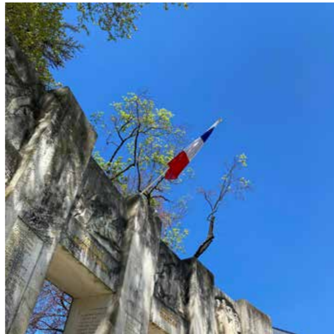
Ecole ESFAEC, Liberté, 2026