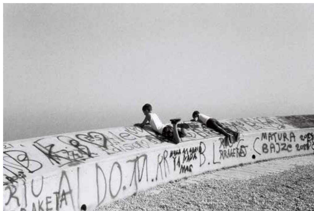
Ethel Grévoul, Demain (2024)