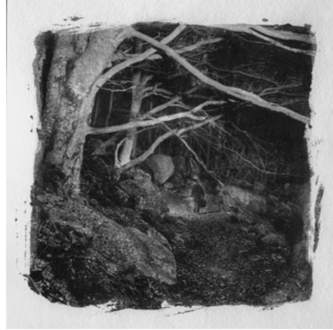
Erik Vacquier, L'homme blessé, SD